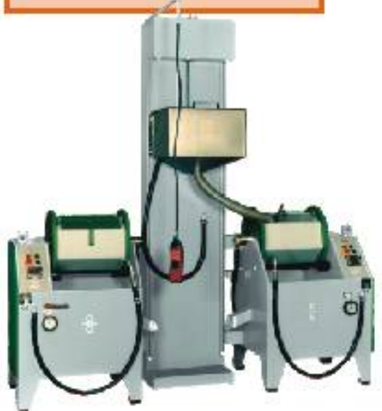
2 Maschinen VT1 mit Liftanlage 2 VT1 units combined with lift